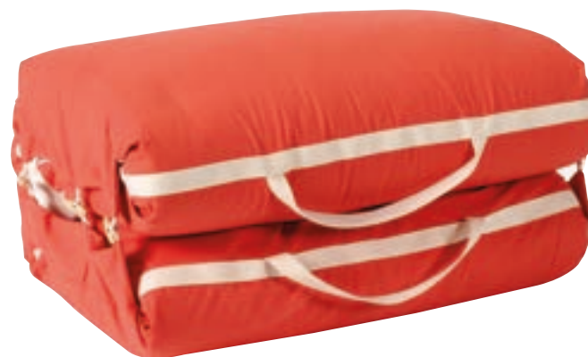
Futon vagabond 70 x 200 ..... 335€